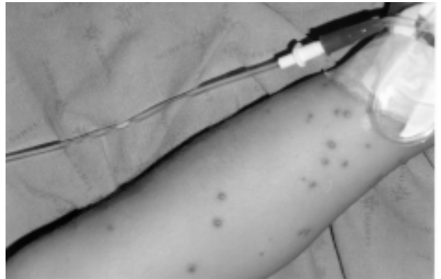
Figura 2 - Lesões tipo pústulas que se formam em 24 horas

familiares coletar as formigas que haviam picado o menino e estas foram encaminhadas ao Departamento de Biologia da PUCRS para classificação, cujo resultado foi o seguinte: Artrópode, família Formicidae , ordem Hymenoptera , gênero Solenopsis , espécie invicta .